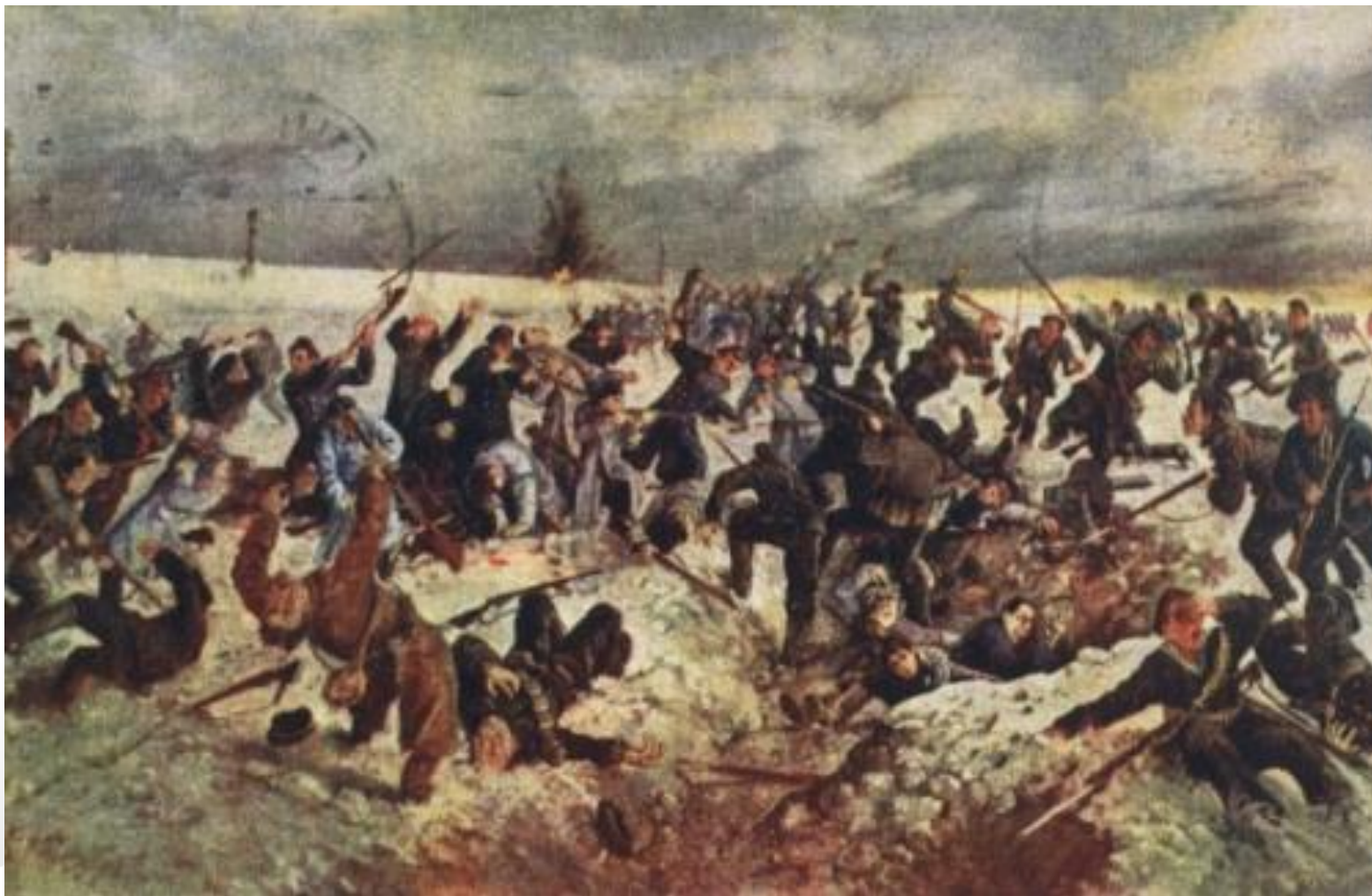
Картина А.Климко «Бій під Крутами»

В Україні 29 січня відзначається як День пам'яті Героїв Крут – однієї з трагічних і водночас високо легендарних сторінок в історії української визвольної боротьби 1917-1921 рр.