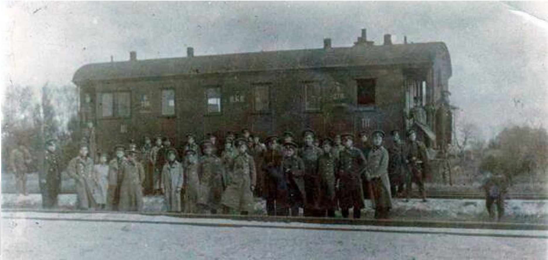
Студенти на станції Крути, фото незадовго до бою

Добровольці почали тренування, які продовжувались не більше тижня, до 26 січня. Вранці 28 січня сотні студентського куреня прибули на станцію Крути та почали рити окопи, займаючи позиції. Озброєння катастрофічно бракувало – загін мав лише 16 кулеметів, невеликий бронепоїзд та обмаль патронів.