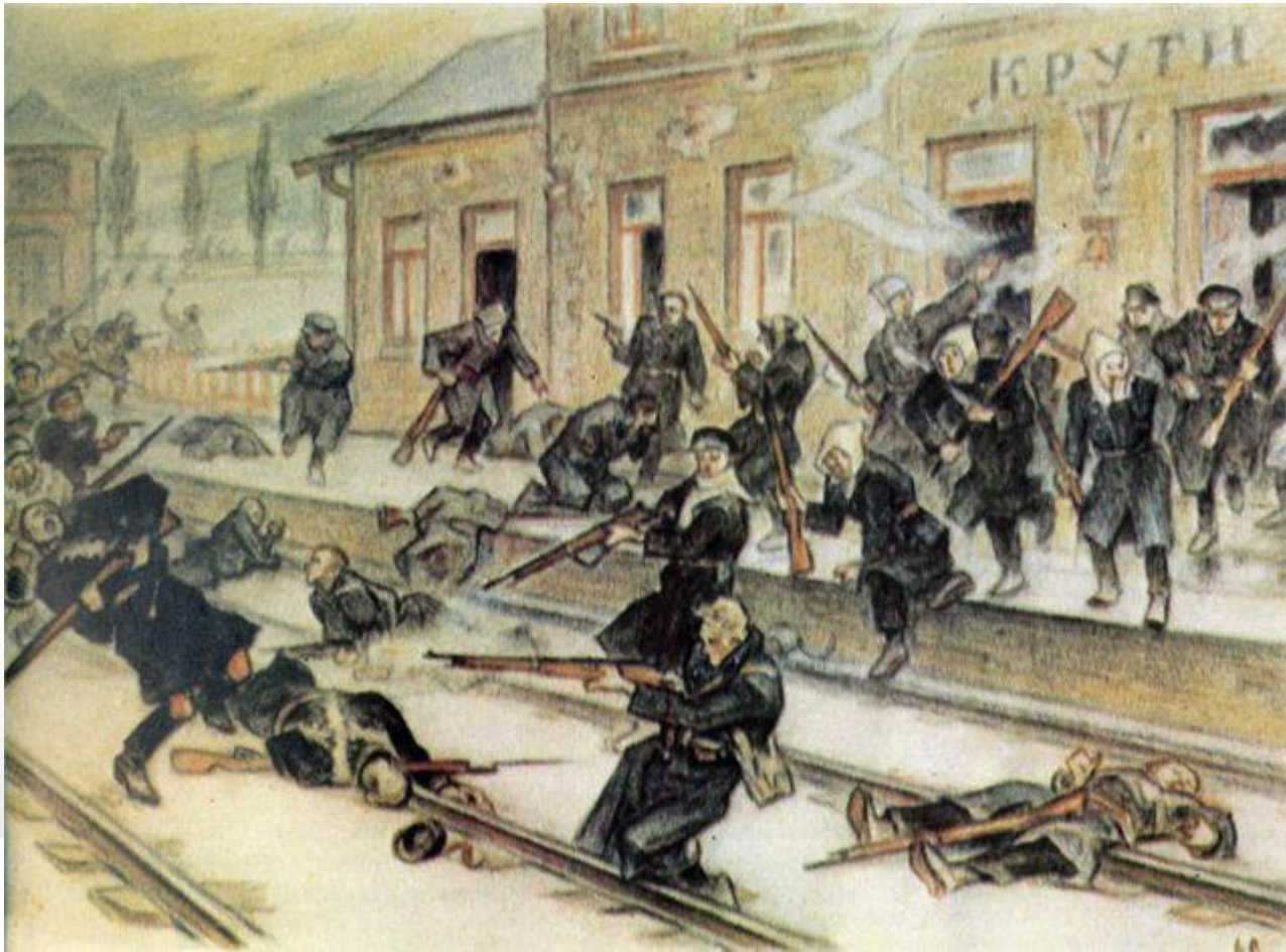
Картина Леонід Перфецький « Бій під Крутами »

Цей бій тривав 5 годин між 4-тисячним підрозділом російської Червоної гвардії під проводом есера Михайла Муравйова та загоном із київських курсантів і козаків «Вільного козацтва», що загалом нараховував близько чотирьох сотень вояків.