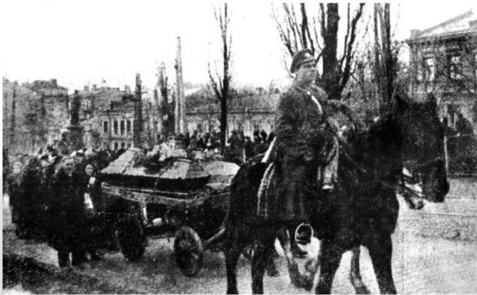
Фрагмент похоронної ходи вулицями Києва. Київ, 10 (23) березня 1918 р.

На похороні в Києві біля Аскольдової могили голова Української Центральної Ради Михайло Грушевський назвав юнаків, які загинули в нерівній боротьбі, героями, а поет Павло Тичина присвятив героїчному вчинкові вірш «Пам'яті тридцяти».