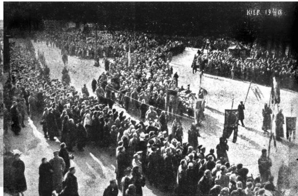
Перепоховання загиблих героїв Крут. Київ, 10 (23) березня 1918 р.